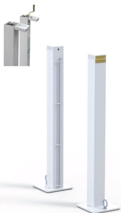
Poteaux à cheviller Acier galva plastique blanc 80 x 80 mm Tension par vis sans fin incorporée dans le montant